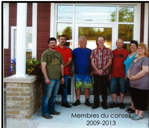
Membres du conseil 2009-2013