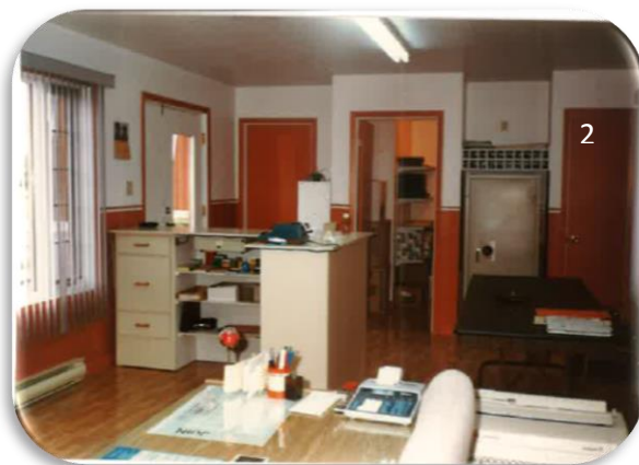
Photos 1 et 2 : En 1985, Francine occupe ses fonctions dans un nouvel environnement au 6081, chemin de l'Église