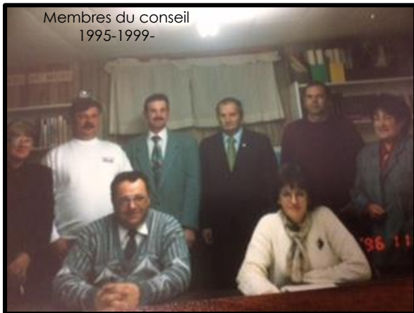
Membres du conseil 1995-1999-