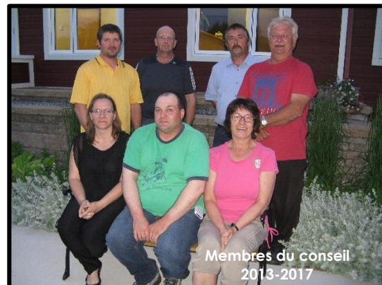
Membres du conseil 2013-2017