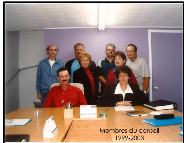
Membres du conseil 1999-2003