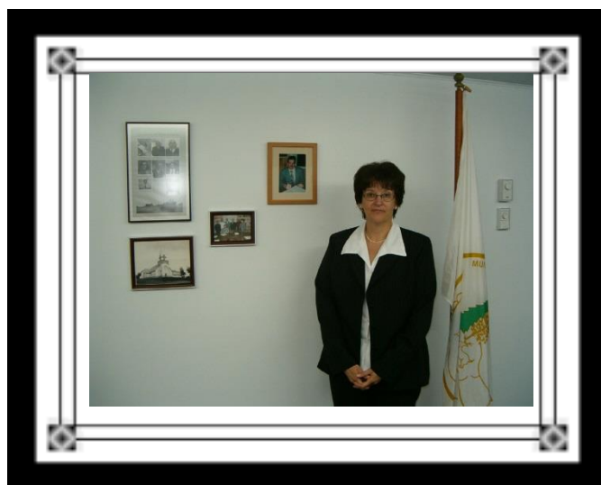
2005 : une somme de 30 ans de travail