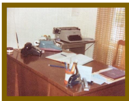
Son premier bureau de travail dans la maison de ses parents située au 6207, chemin de l'Église