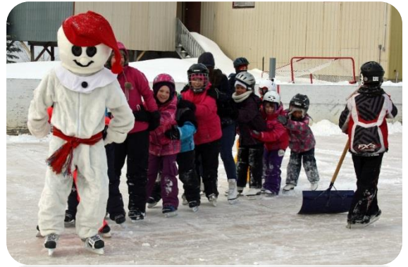
Quelques photos souvenirs de la Semaine de relâche